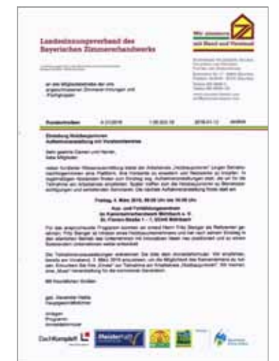
Rundschreiben für Mitglieder