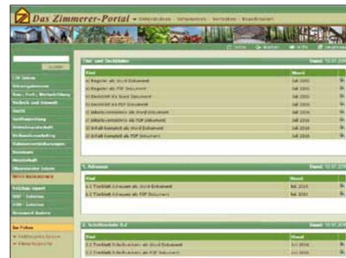
LIV Intern: exklusiver Mitgliederbereich