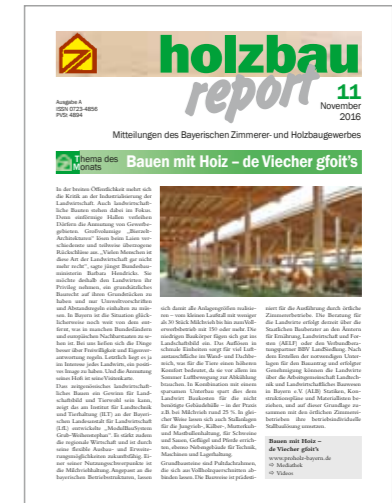
Mitteilungsblatt holzbau report